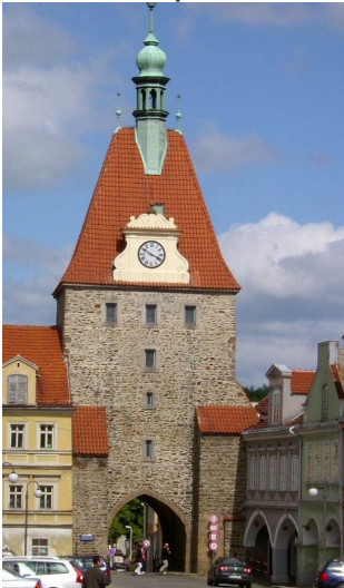
Tor zum Marktplatz