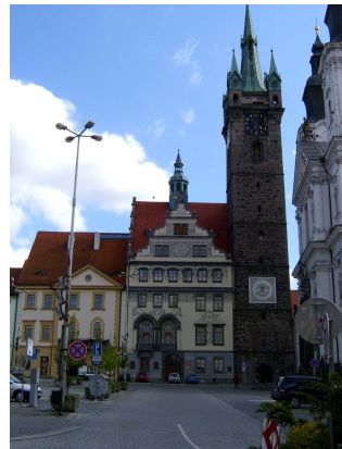
Marktplatz mit einer von vielen Kirchen