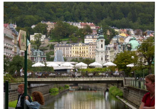
Blick in das Herz der Stadt