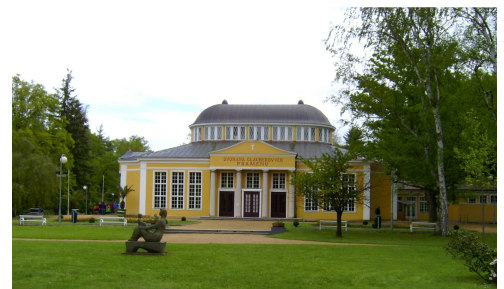
Haus der Glauberquelle